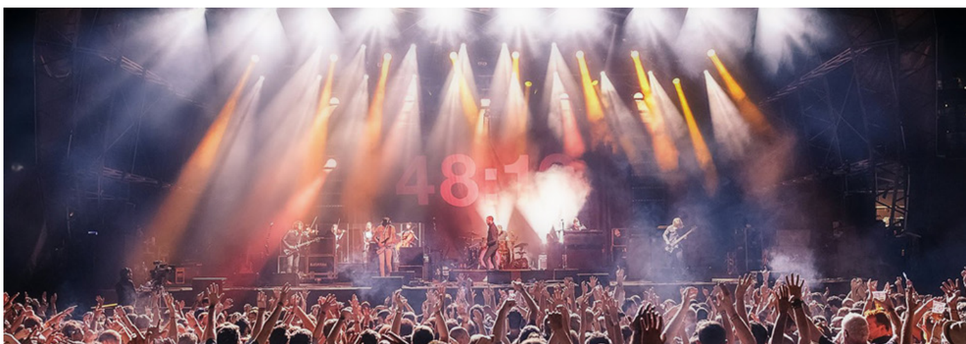
KASABIAN på scenen ved årets Blended festival i Dubai, hvor strygersektionen benyttede REMIC mikrofoner til violin, bratsch og cello.

I løbet af sommeren har REMIC været med til at berige en lang række festivalgæster med den rene og ægte lyd. Vi er beærede over de fine tilbagemeldinger, vi har fået fra kunstnere og lydteknikere verden over. Det går stærkt hos REMIC for tiden og sommeren har ligeledes budt på nye marketingkompetencer i REMICs team, en række nye forhandlere af vores produkter samt en crowdfundingkampagne i støbeskeen.